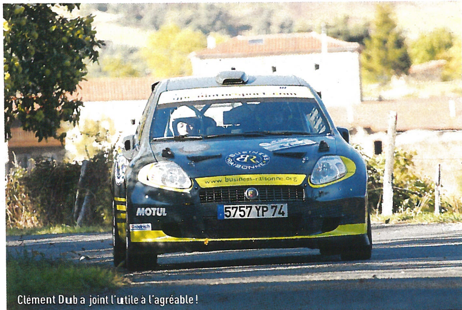
Clément Dub a joint l'utile à l'agréable !