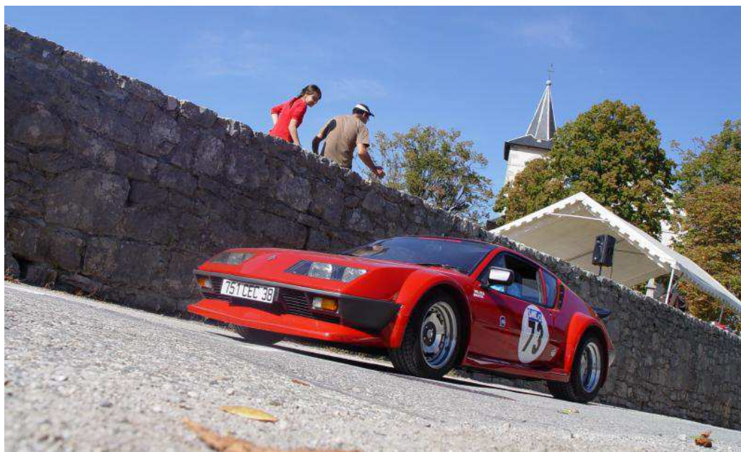
La montée historique de Montagnole